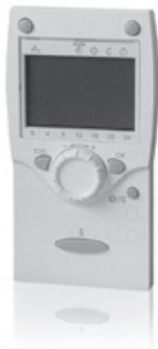
Комнатный термостат и компактный блок управления QAA75